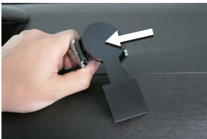
本体にステーを貼り付けます