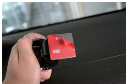
ステーの保護紙をはがします