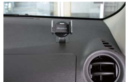
ステーを任意の角度に曲げて 設置する場所に貼り付けます