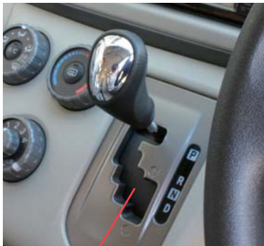
ゲート式シフトノブ