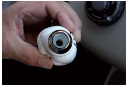
※インサーターの取付後